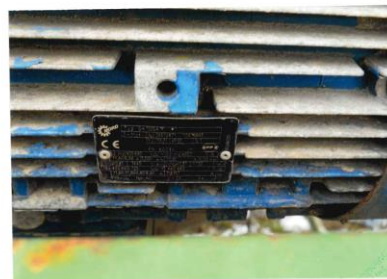
Załącznik do opinii BK-130/23